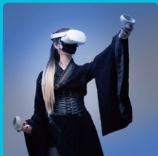
VRアーティスト SaRaN サラン